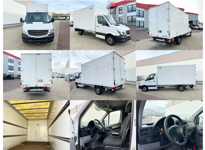
DAIMLER-BENZ Sprinter 313 CDI 4x2, 5x Vorhanden!

Preis(brutto): 22.015,00 € gesetzl. MwSt.19%: 3.515,00 €