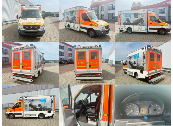
DAIMLER-BENZ Sprinter 516 CDI 4x2, Rettungswagen, Bi-Xenon

Preis: 31.900,00 € MwSt. nicht ausweisbar