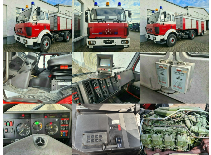
DAIMLER-BENZ SK 1838 4x2 Feuerwehr