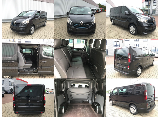
RENAULT (F) TRAFIC 4x2, 6 Sitze, Business, Navi, Klima

Preis(brutto): 26.061,00 € gesetzl. MwSt.19%: 4.161,00 €